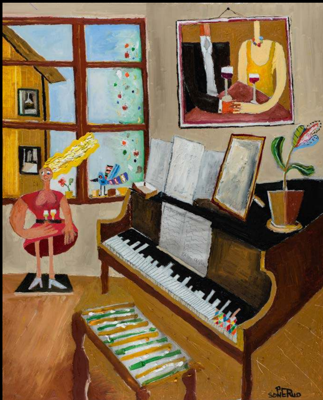
Flygel med röd dam 93 x 72 cm