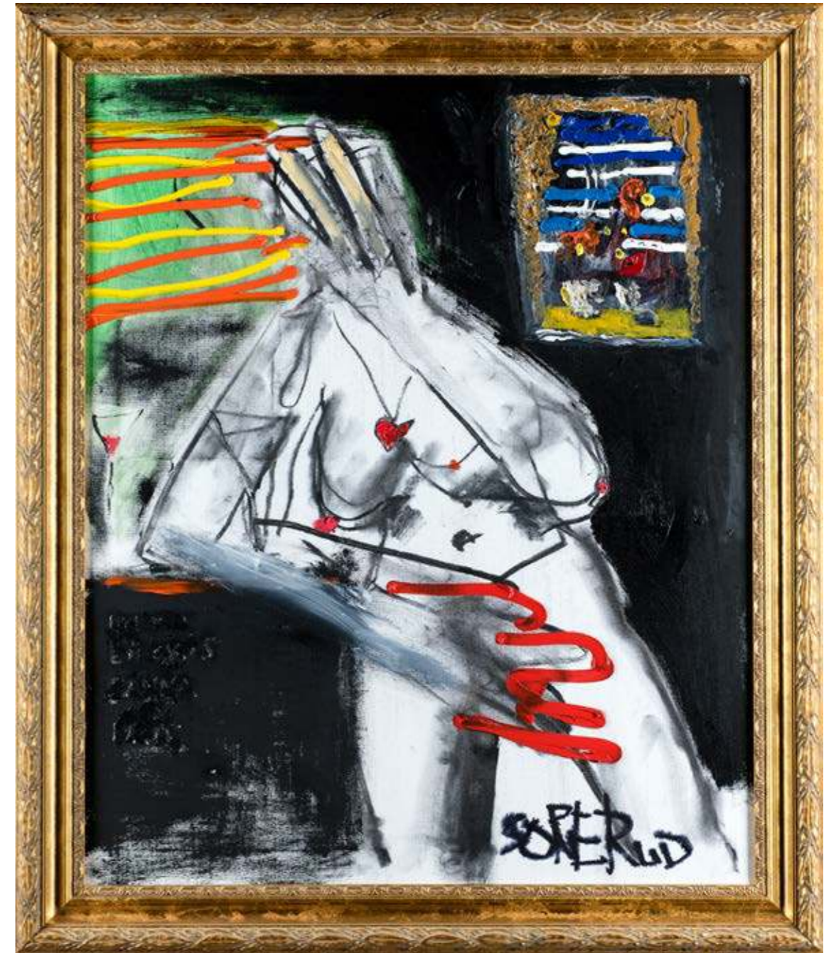
Young Girl 73 x 60 cm

Var flygeln efter detta tagit vägen låter historien inte berätta men klart är att förbannelsen vilade kvar och att hammarflygeln därtill har blod på sitt samvete.