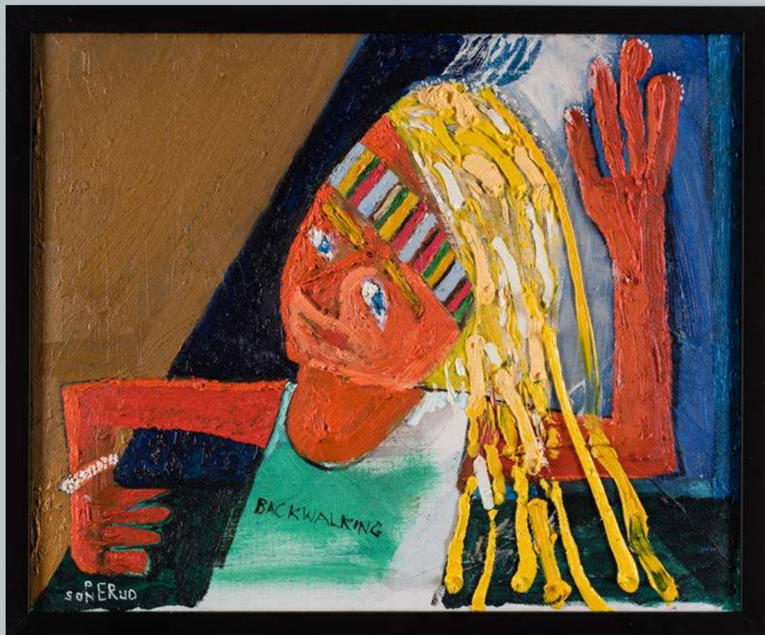
Back-walking 35 x 43 cm