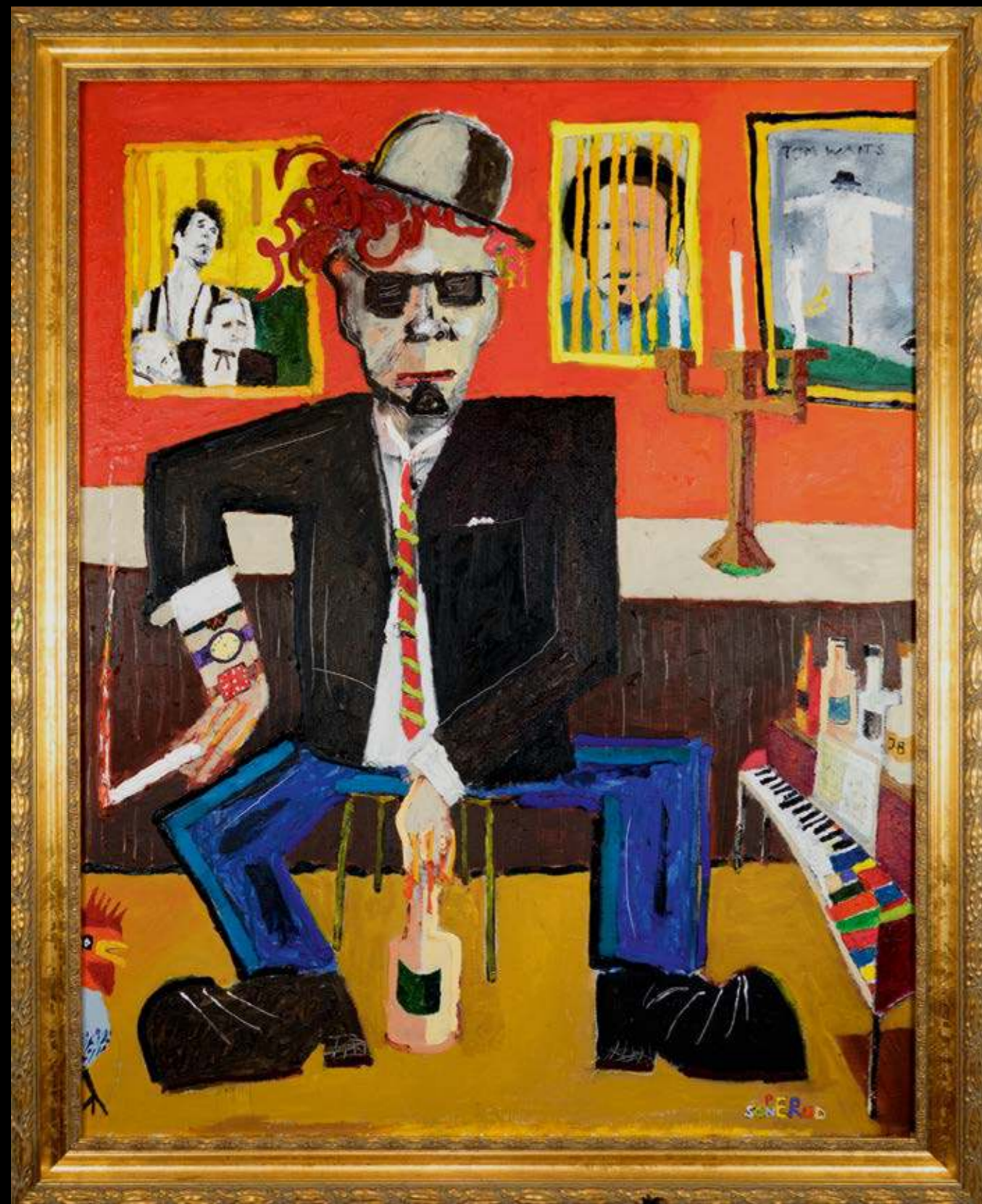
Tom Waits 93 x 72 cm